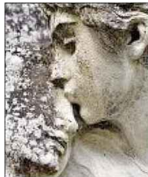
NÉRIS. Sculpture dans le jardin du château de la Louvière.

HYDS. Fête patronale (animations). À 10 heures, messe suivie du marché du terroir et de l'artisanat ; à 12 h 30, paella géante (fromage, dessert et café) ; à 15 heures, Claude Arena chantera Mike Brant. Tarif : 8 euros (repas).