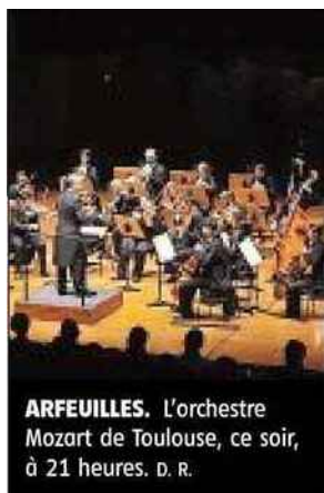
ARFEUILLES. L'orchestre Mozart de Toulouse, ce soir, à 21 heures.